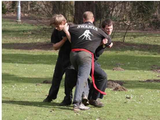
Leden van SwArta tijdens weerstandsoefening

Daarnaast kan men ook nog de natuurlijke, biologische weerbaarheid versterken. Door het trainen in weer en windt looit de mens als het ware zijn huid. Door het incasseren van slag en stoot harden we het lichaam en leren we ons geestelijk beheersen. Er bestaat een duidelijke wisselwerking tussen de geestelijke en fysieke weerbaarheid. Zij versterken elkaar.