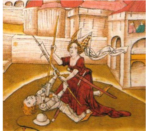
Weerbaarheid: een zaak voor beide seksen Afbelding uit een Zwitserse kroniek

De overlevering en beoefening van deze kunsten behoort niet toe aan het verleden, maar aan het tijdloze. Het is ons gegeven om dankzij hen tot inzichten te komen.