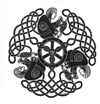
De Nornen spinnen het levensweb

Volgens het Germaanse geloof wordt het lot ons opgelegd bij de geboorte. De drie Nornen, Urd, Verdandi en Skuld (Oorsprong, Wording en Schuld) spinnen onze levensdraden ( örlogrþátr ) en weven daarmee het levensweb ( örlogsímu ) of het ‘web der wording’. Lot en wording hangen dus samen.