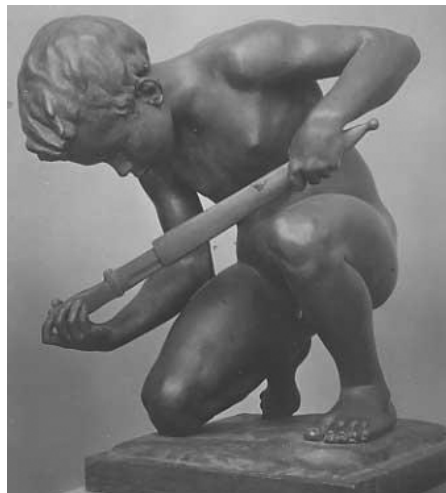
De mens, geboren om te strijden Beeldhouwer onbekend

De Romeinse spreuk 'qui desiderat pacem, bellum praeparat' of 'si vis pacem, para bellum' (wie naar vrede verlangt bereidt zich best voor op oorlog) toont in die optiek ook zijn diepere betekenis: de innerlijke vrede die in het oerlot besloten ligt roept een religieuze strijd op. Dit is een strijd om zich af te stemmen op de Goddelijke symfonie, een strijd tegen chaotische elementen in het leven ter bevordering van Mate en Orde, voor het behoud van de Kosmos. Dit is geen Heilige Oorlog of Jihad in de zin van religieuze intolerantie!