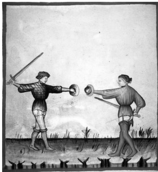
Terug van weggeweest: de beoefening van Westerse krijgskunsten Manuscript - 14 de eeuw

Het is één der beweegredenen van SwArta om de Traditie der oude Westerse wapenstijlen nieuw leven in te blazen. We willen hen een waardige plaats toekennen onder de hedendaagse Krijgskunsten. Daarbij draait het ons niet om het tentoon spreiden van het meest spectaculaire of het verkondigen van het meest effectieve t.o.v. andere stijlen, maar om de ware geest van de Kunst, welke is: 'deelnemen aan een Eeuwige Ordening en Harmonie'. Dit staat in tegenstelling tot kunst met kleine 'k', wat slechts een egoverheffende reproductie is en geen bezieling kent. Ik begrijp het, wat hier geschreven staat en volgt zal voor velen onder u een openbaring zijn. Maar krijgskunst is nu éénmaal meer dan vechten alleen! Het is geen strijden om de strijd zelf... .