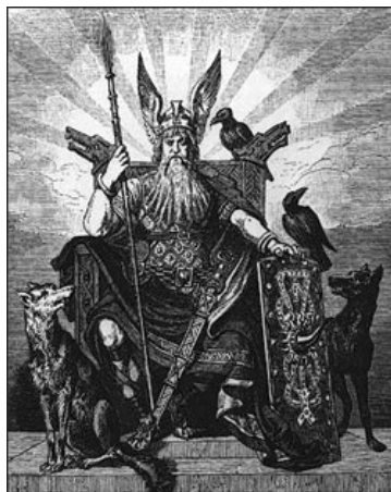
Odin draagt het lot en dient daarbij de mens tot voorbeeld

Het feit dan mensen niet kunnen ontsnappen aan machten die buiten het eigen doen en laten werkzaam zijn maakt hen tot slachtoffer. Het is door deze machten en de bestaansgrond ervan te erkennen dat men constructief met het leven kan omgaan. De oude Germanen voelden zich, zoals reeds eerder verduidelijkt, ‘gebonden’ door de oerwet. Het noodlot werd voor hen begrijpbaar in de functies van hun Goden. Ze droegen in de strijd armrings en knoopten gordels en haren om dit verbond met de Goden en het noodlot te bekrachtigen. Maar de Goden zijn niet het noodlot. Ook zij zijn als principes van het Goddelijke door deze hogere wet gebonden. De God Odin is daar één van de mooie voorbeelden van.