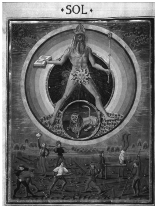
Het zich bekwamen in martiale kunsten: niets nieuw onder de zon Astrologische plaat, 15 de eeuw

Gelukkig is er genoeg materiaal nagelaten om deze 'Kunst' haar onsterfelijk karakter te verlenen. Om ons de wapenkunde eigen te maken, volstaat het niet alleen om haar praktisch te reconstrueren maar ook om de sacraliteit welke ermee verbonden is terug in ons op te nemen. Enkel dan wordt de Traditie in ere hersteld en wordt de beoefening zinvol. Het is ons daarbij belangrijk te weten waarom de mens 'strijdt', in de meest daadwerkelijke betekenis van het woord. Welke zijn de innerlijke beweegredenen voor de beoefening van een krijgskunst zoals bvb. die van het langzwaard? Deze vechtstijl heeft immers als verdedigingswijze geen enkele applicatie meer. Gaat het om nostalgie? Of kan er meer zijn?